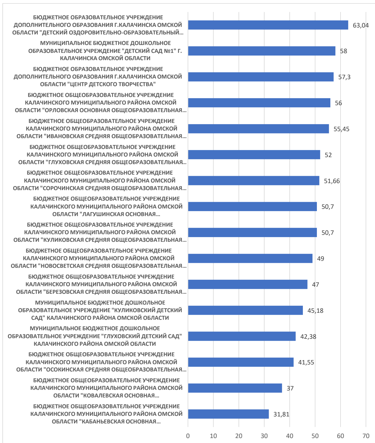
Рисунок 3 – Рейтинг организаций по критерию «Доступность образовательной деятельности для инвалидов»