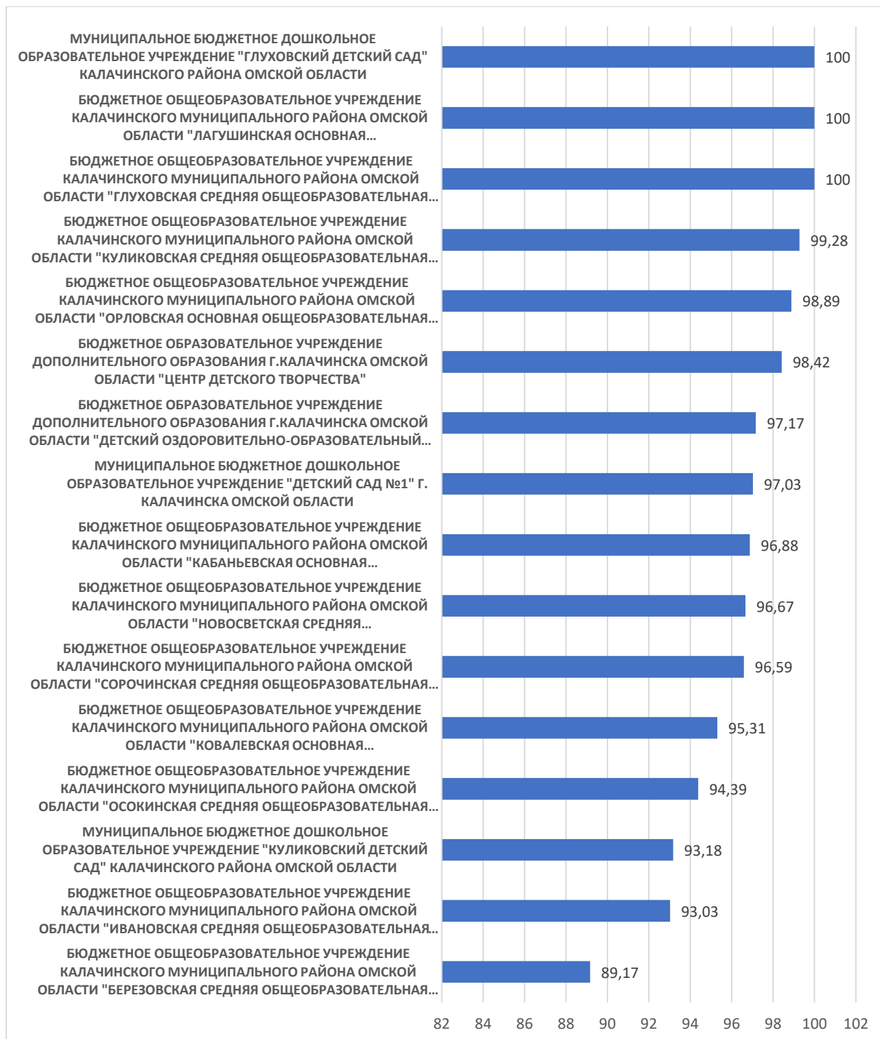
Рисунок 2 – Рейтинг организаций по критерию «Комфортность условий, в которых осуществляется образовательная деятельность»