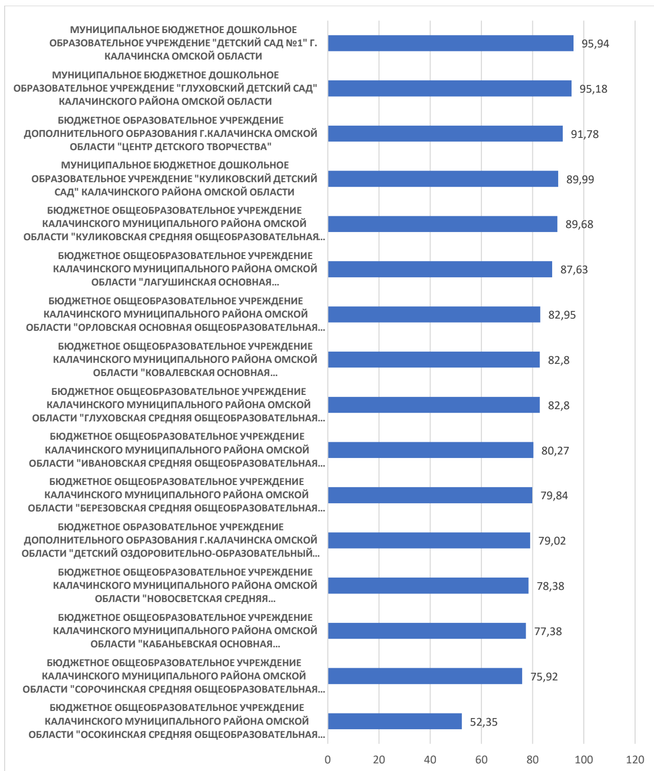
Рисунок 1 – Рейтинг организаций по критерию «Открытость и доступность информации об организации, осуществляющей образовательную деятельность»